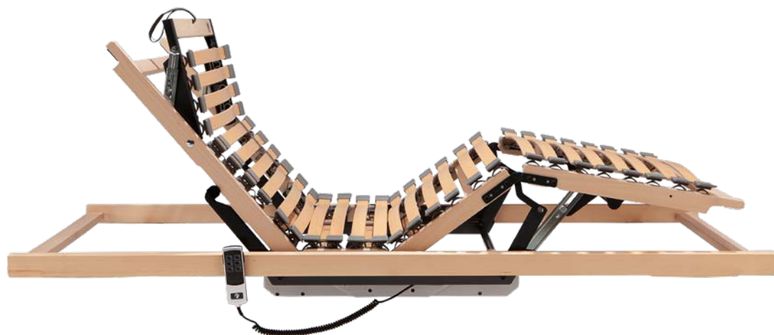
3. RAHMEN DORMABELL CLASSIC M2 K 1.499,-