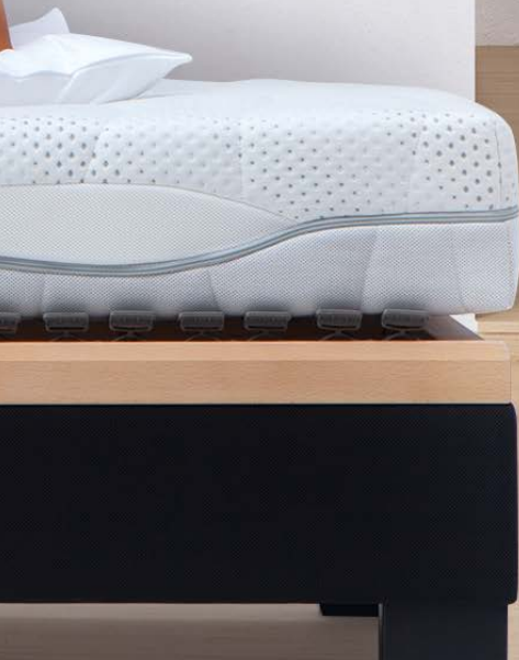
1. MATRATZE DORMABELL CLASSIC S CLEAN 679,-