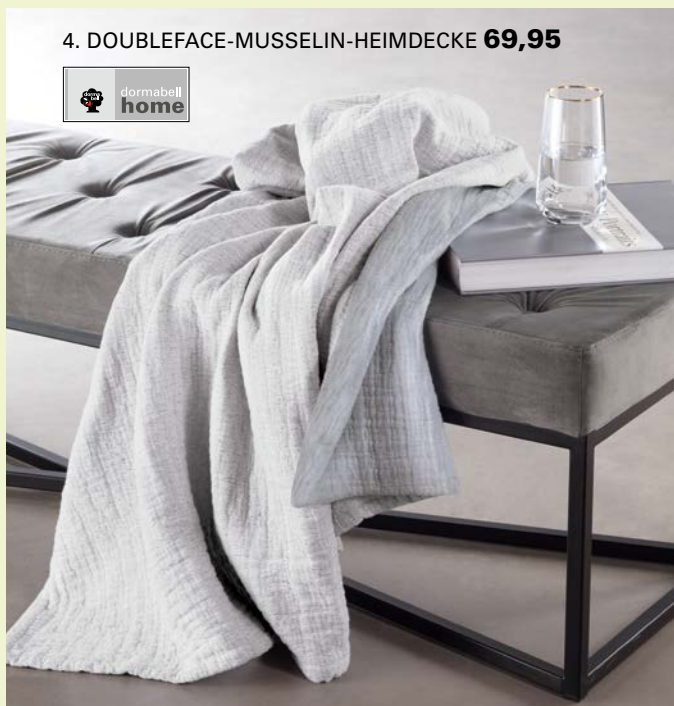
4. DOUBLEFACE-MUSSELIN-HEIMDECKE 69,95