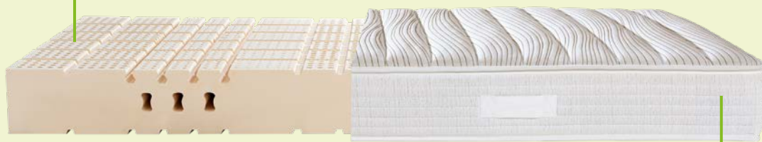
7. MATRATZE DORMABELL CLASSIC L WOOL 1.349,-

Der Matratzenkern aus 100 % FSC®-zertifiziertem Naturlatex passt sich optimal an den Körper an und verbessert die Schlafqualität spürbar.