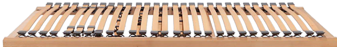
2. RAHMEN DORMABELL CLASSIC N 479,-