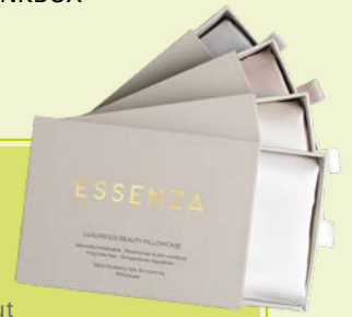
3. SEIDEN-SCHLAFMASKE 29,95 IN EDLER GESCHENKBOX ESSENZA